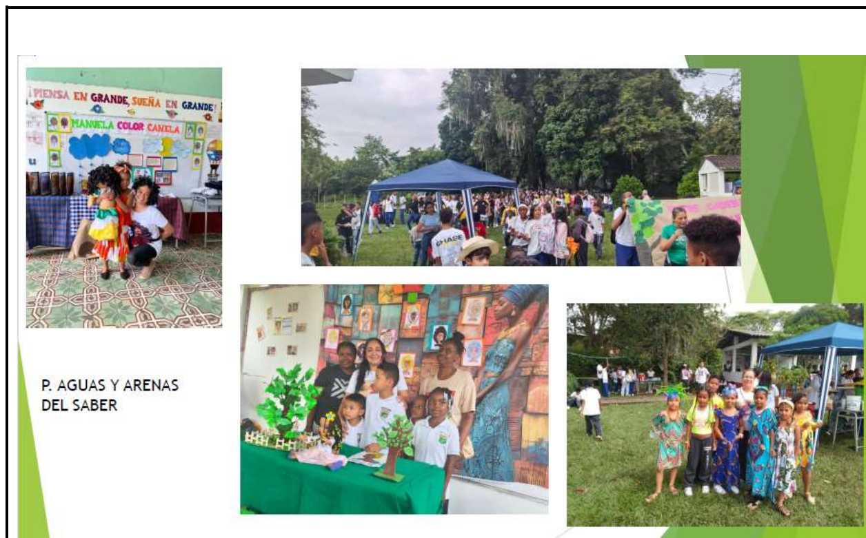
P. AGUAS Y ARENAS DEL SABER